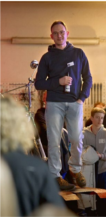
Ein guter Grund zum Anstossen.