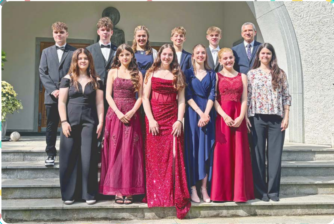
Konfirmation Klassen Gabci vom 17. Mai 2026