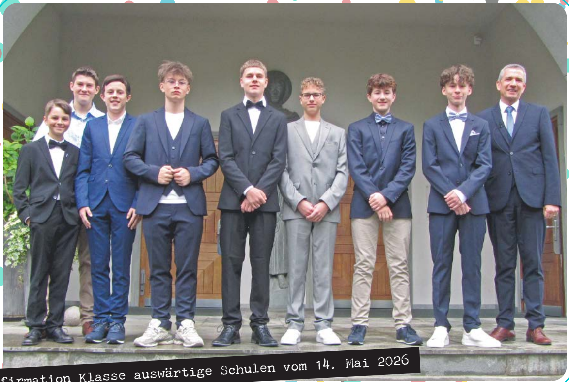
Konfirmation Klasse auswärtige Schulen vom 14. Mai 2026