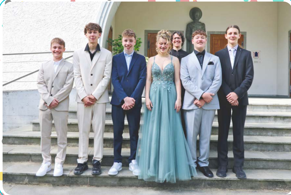
Konfirmation Klassen 9ef vom 26. April 2026