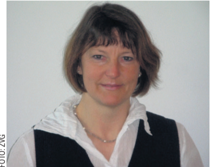
Zusammenleben sowie eine tolle Zusammenarbeit!

Was wünschen Sie sich für unsere Kirchgemeinde? Ein friedliches und harmonisches