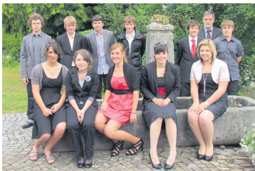
Konfirmation vom 5. Juni 2011