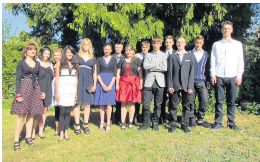
Konfirmation vom 29. Mai 2011